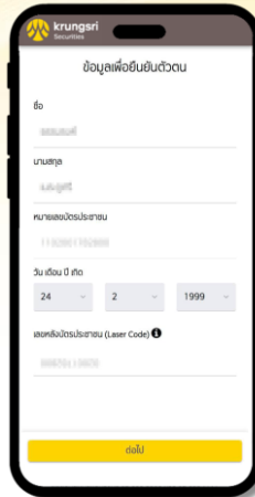
3 กรอกข้อมูลส่วนบุคคลเบื้องต้นเพื่อตรวจสอบ