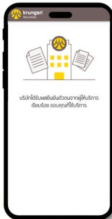
11 ยืนยันตัวตน สำเร็จ