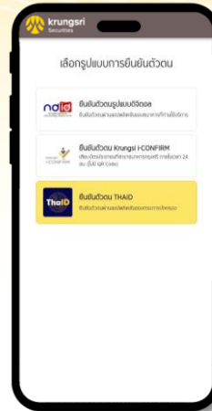
4 เลือกการยืนยันตัวตนด้วยบริการ ThaiID