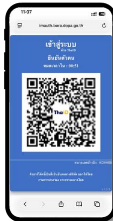
7 เชื่อมต่อไปยัง Application ThaiID