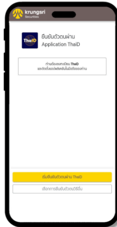
6 คลิก เริ่มยืนยันตัวตนผ่าน ThaiID