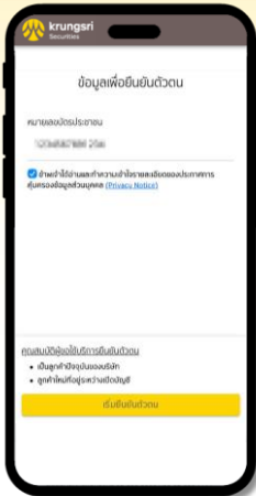
1 กรอกเลขบัตรประชาชน เพื่อเริ่มยืนยันตัวตน