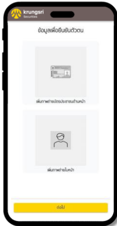
5 เริ่มยืนยันตัวตนด้วยภาพถ่ายบัตรประชาชน & ภาพถ่ายใบหน้า