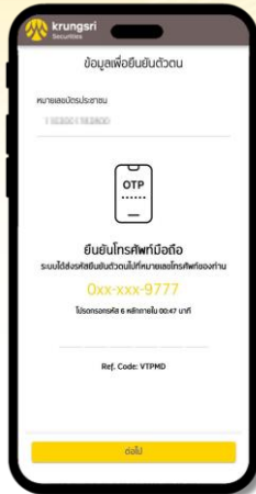
2 กรอกเลข SMS OTP เพื่อยืนยัน เบอร์โทรศัพท์มือถือ