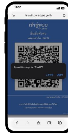
8 คลิก "Open" เพื่อเปิด Application ThaiID