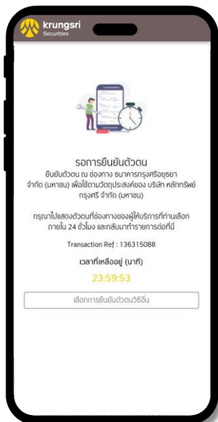
6 กรุณาไปดำเนินการยืนยันตัวตน ณ จุดบริการ ภายใน 24 ชั่วโมง