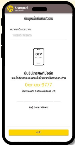
2 กรอกเลข SMS OTP เพื่อยืนยันเบอร์โทรศัพท์มือถือ