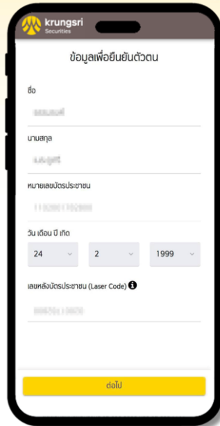
3 กรอกข้อมูลส่วนบุคคลเบื้องต้นเพื่อตรวจสอบ