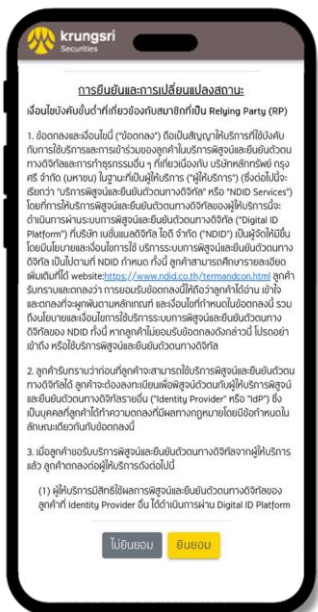
5 อ่านข้อตกลง & เงื่อนไข และคลิก "ยืนยัน"