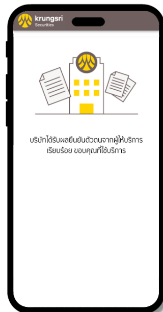
8 ยืนยันตัวตน สำเร็จ

สามารถทำรายการยืนยันตัวตน ณ จุดบริการ Krungsri i-CONFIRM ที่สาขานาอาคารกรุงศรีฯ ทั่วประเทศ